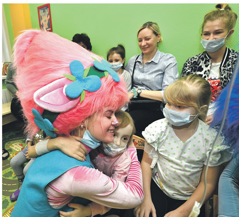
Детские онкопатологии лечатся в разы успешнее – выздоравливают примерно 75 % заболевших ребят, по некоторым диагнозам число побед превышает 90 %

Дети собираются в игровой комнате, перешептываются «сейчас что-то будет!». Одним только-только поставили укол, другие не вытерпели и пришли на праздник вме-