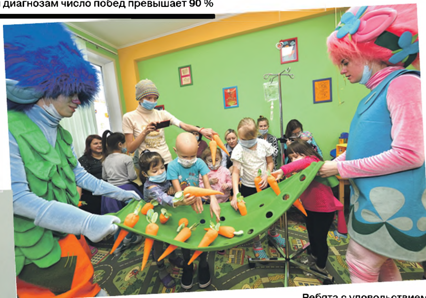
Ребята с удовольствием отправились с троллями в увлекательное приключение

Любимые персонажи вовлекают ребятшек в приключение: они вместе проходят через цветные джунгли,