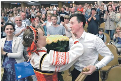
Благотворительный концерт в поддержку пострадавшего в ДТП артиста балета Сергея Бобкова. Собрано и переведено 552 291,4 рубля